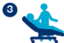
Prélèvement 7 à 10 min.