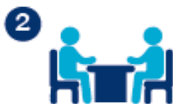
Entretien préalable au don